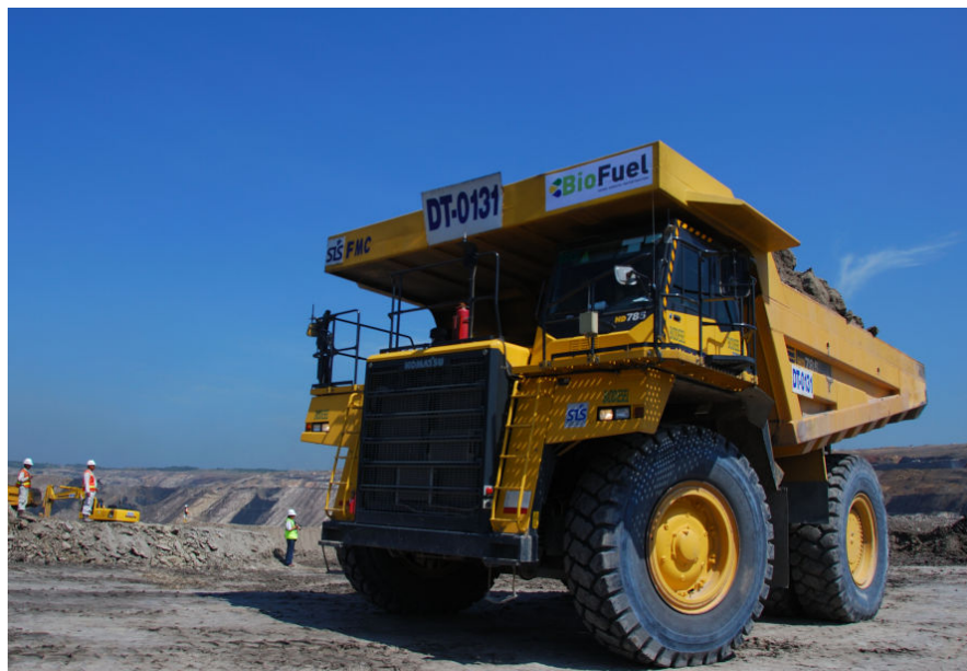
The HD785 dump truck in test operation